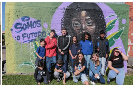
Vereadores Mirins 2023 na cerimônia de Diplomação no Plenário Luiz Osvaldo Bender e em visita à Univale - Cooperativa de Catadores de Materiais Recicláveis de Novo Hamburgo