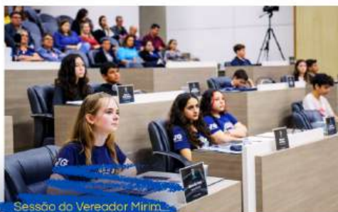
Sessão do Vereador Mirim, realizada em 2023