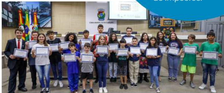
Parlamentares mirins são diplomados em sessão ordinária, após terem sido eleitos dentro de suas escolas. Estão prontos para representar a comunidade.

Os vereadores são remunerados por sua atuação. Esse pagamento chama-se subsídio, e não salário. O dinheiro é proveniente dos valores arrecadados pela administração municipal por meio da cobrança de impostos.