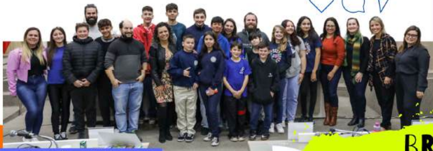
Vereadores Mirins 2023